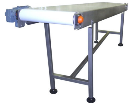
Klantspecifieke transporteur, overgang Ø115 mm